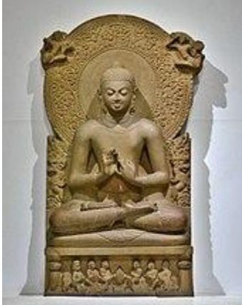
Sebuah patung Buddha Gautama dari Sarnath , abad ke-4 Masehi.